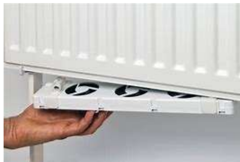
Plaatsen van een radiator ventilator