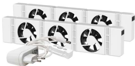
Set van 2 radiator ventilatoren